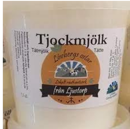
Figur 4. "Tjockmjölk" från några olika producenter inom det geografiska området.